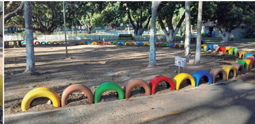
Se ha realizado la instalación y pintado de llantas en el área de piñatas del Parque San José de La Vega.