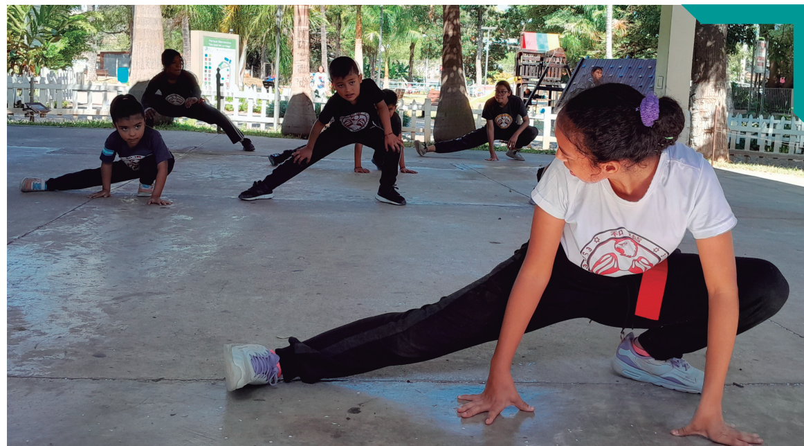
Entrenamiento de Kung Fu, San José de La Vega.