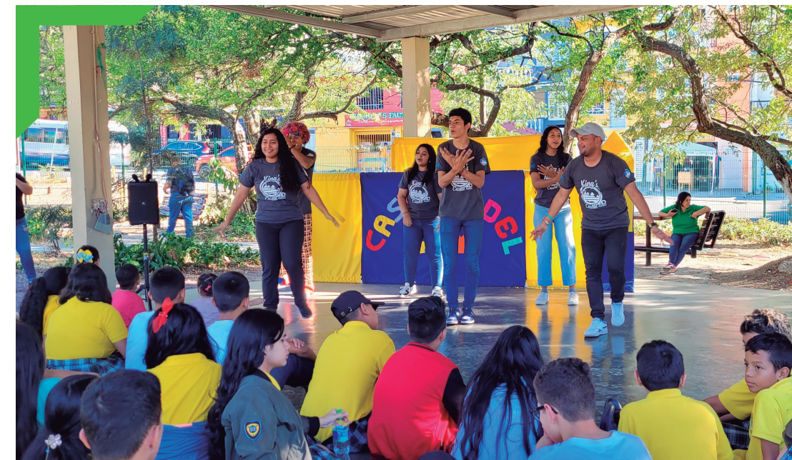
Jornada de evangelización de la Iglesia Castillo del Rey, San Francisco.