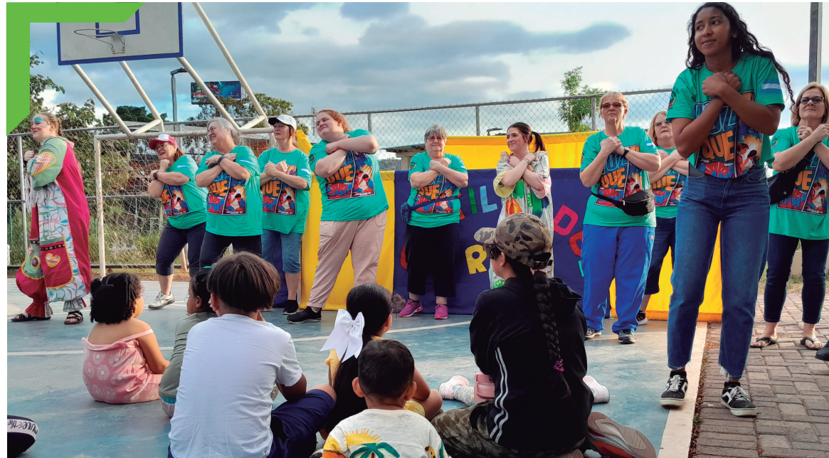
Jornada de evangelización de la Iglesia Castillo del Rey, Altos de La Laguna.