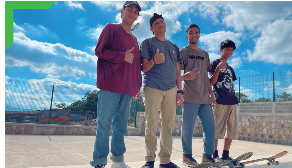
Práctica de skateboarding, Altos de La Laguna.