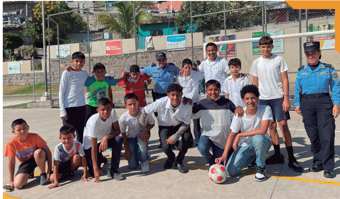
Campamento GREAT, Campo Cielo.