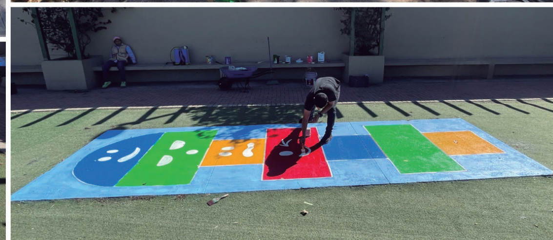
Se ha realizado el pintado del muro de piedra de la entrada, huellas y rayuela del Parque La Amistad, San Francisco.