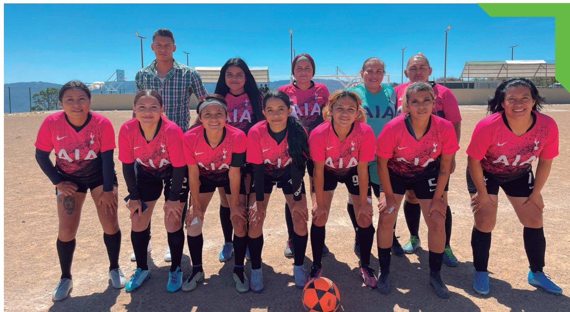
Liga femenina, Altos de La Laguna.