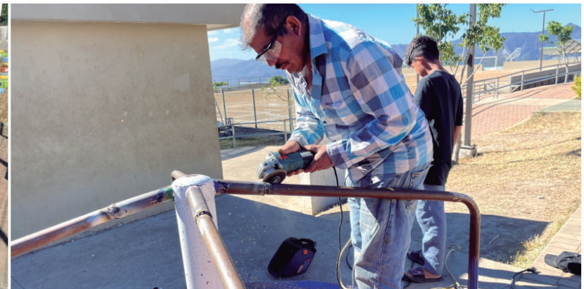
Se han realizado reparaciones al sistema de aguas lluvias y a la rueda giratoria del Parque Altos de La Laguna.