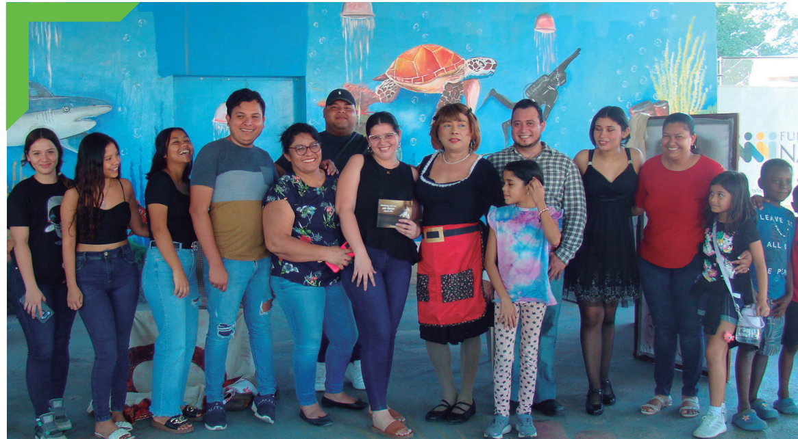
Obra de teatro de la Municipalidad de S.P.S, Rivera Hernández.