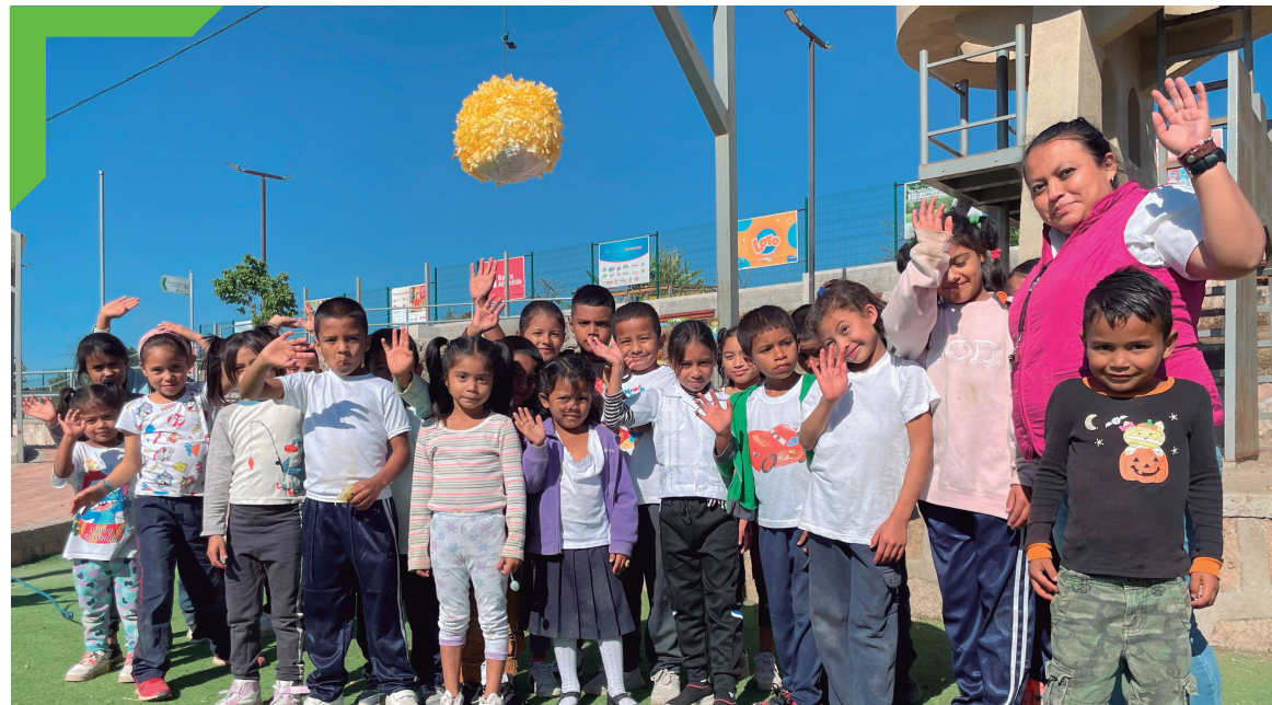
Visita de la Escuela Altos de La Laguna, Altos de La Laguna.