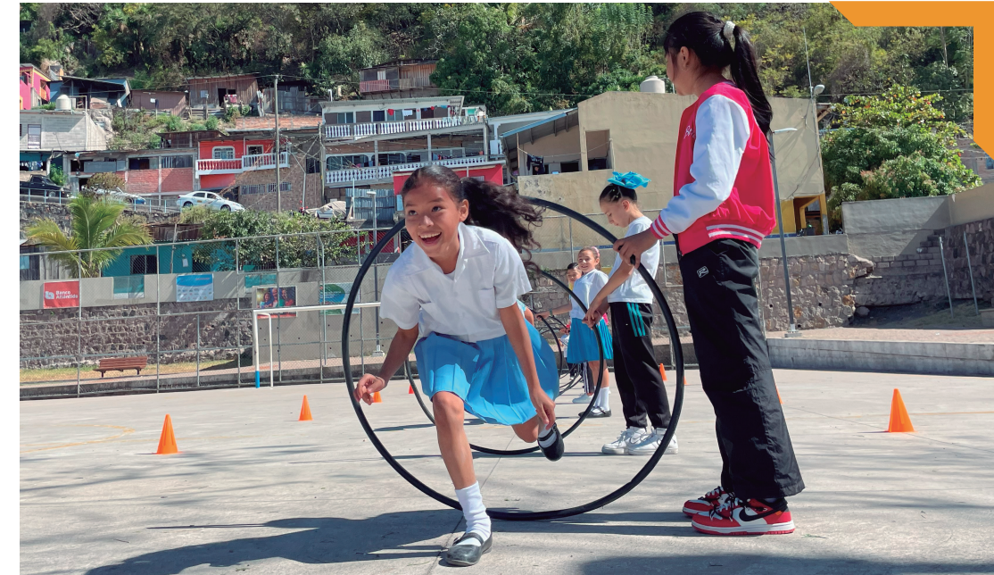
Visita de la Escuela Tiburcio Carías, Campo Cielo.