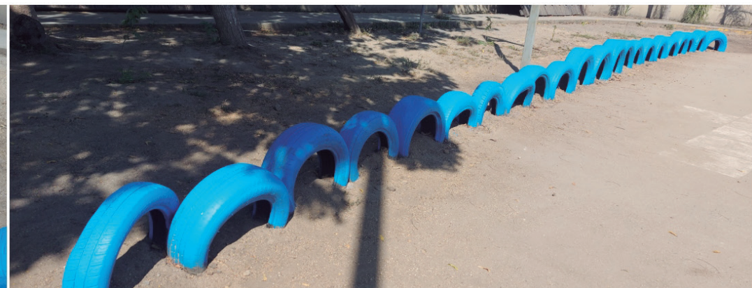
Se ha realizado la instalación y pintado de llantas en el área de piñatas del Parque Rivera Hernández.