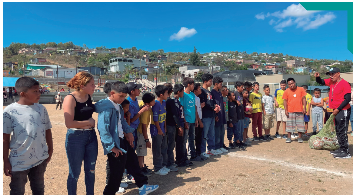
Juegos recreativos organizados por Condepor, Altos de La Laguna.