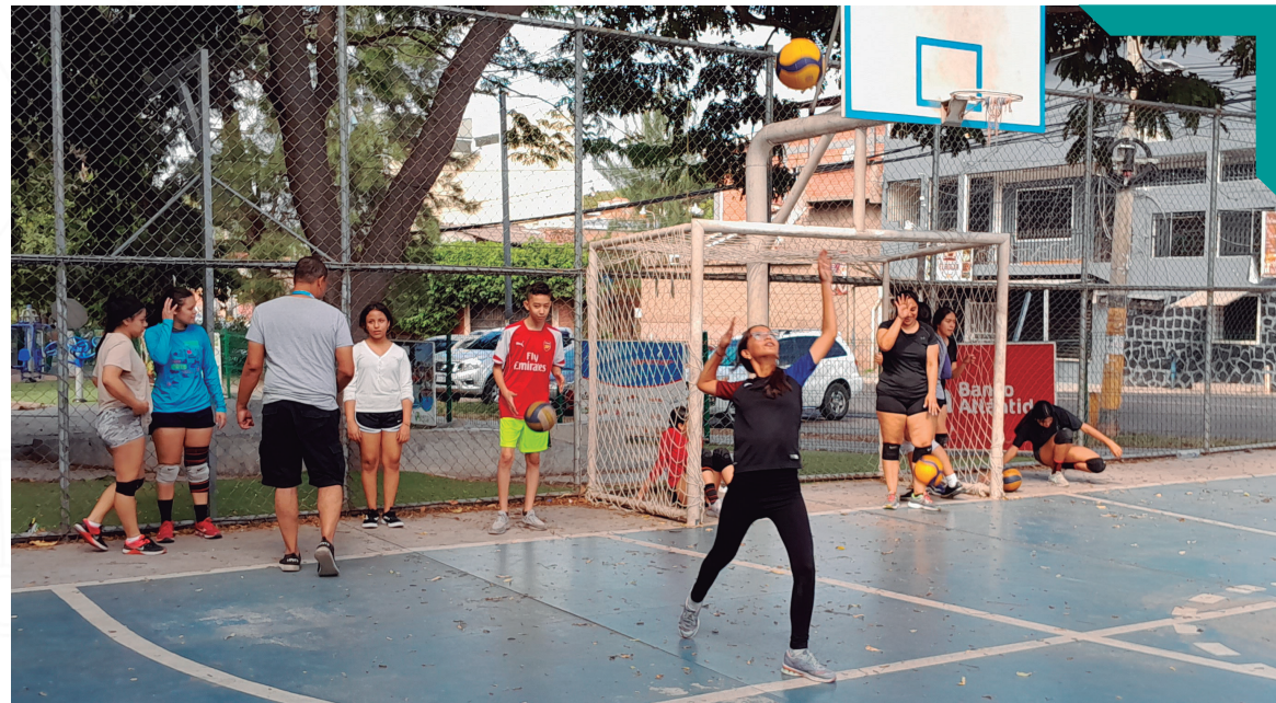
Práctica de voleibol, El Hogar.