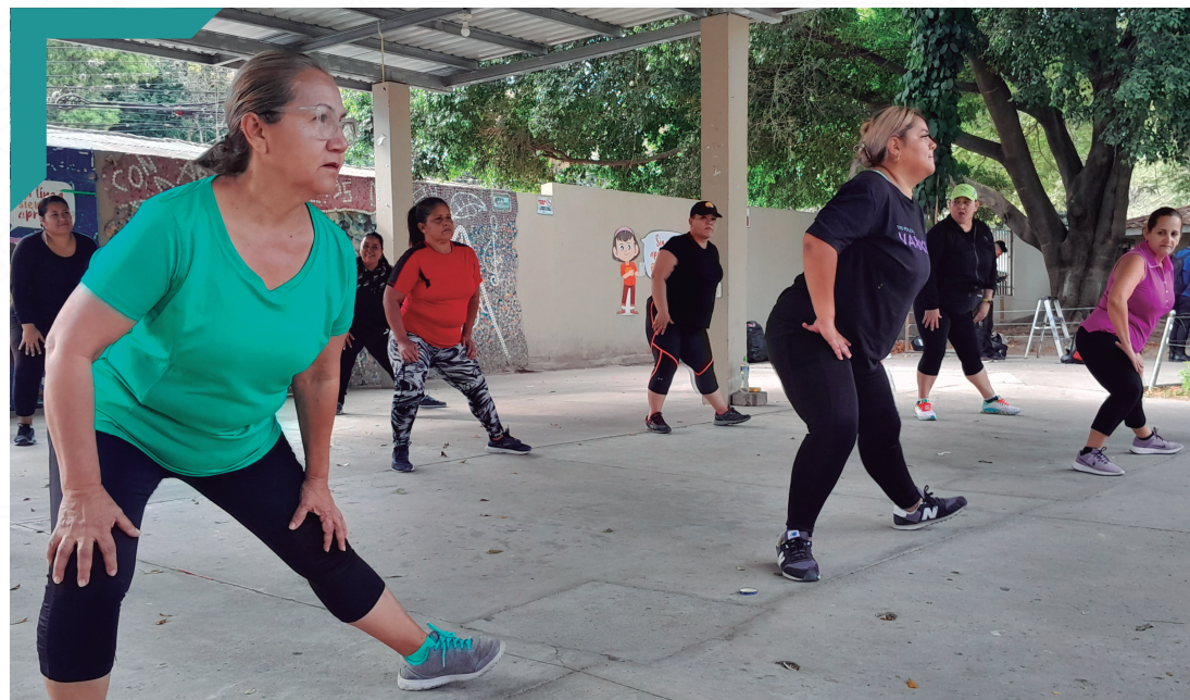
Práctica de zumba, San José de La Vega.