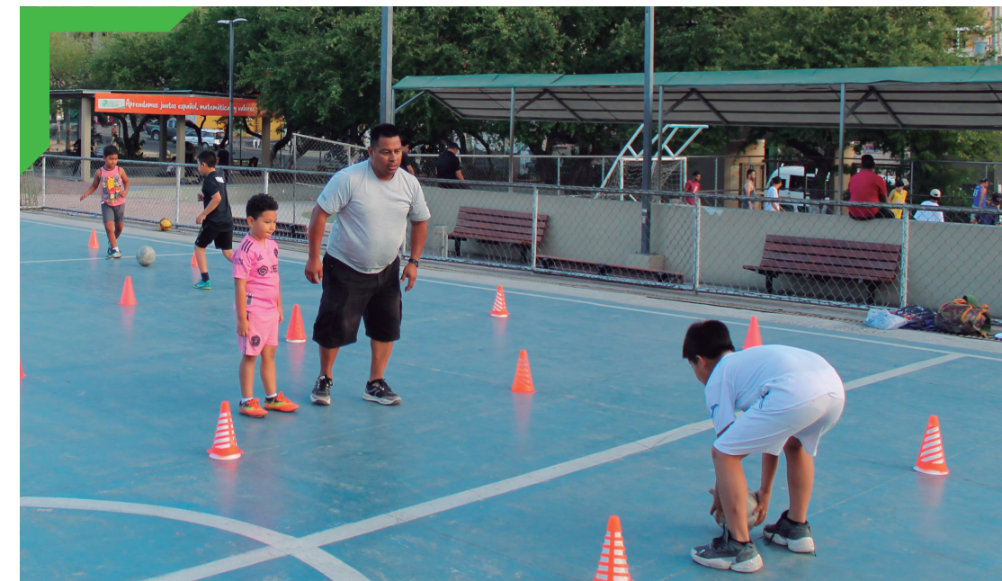
Práctica de fútbol infantil, San Francisco.