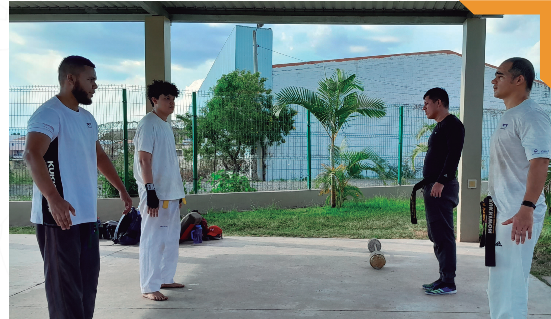
Práctica de taekwondo, El Trapiche.