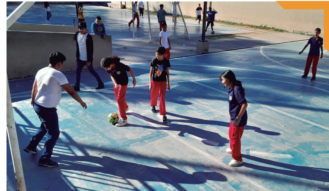
Visita del Instituto San Juan Bosco, San José de La Vega.