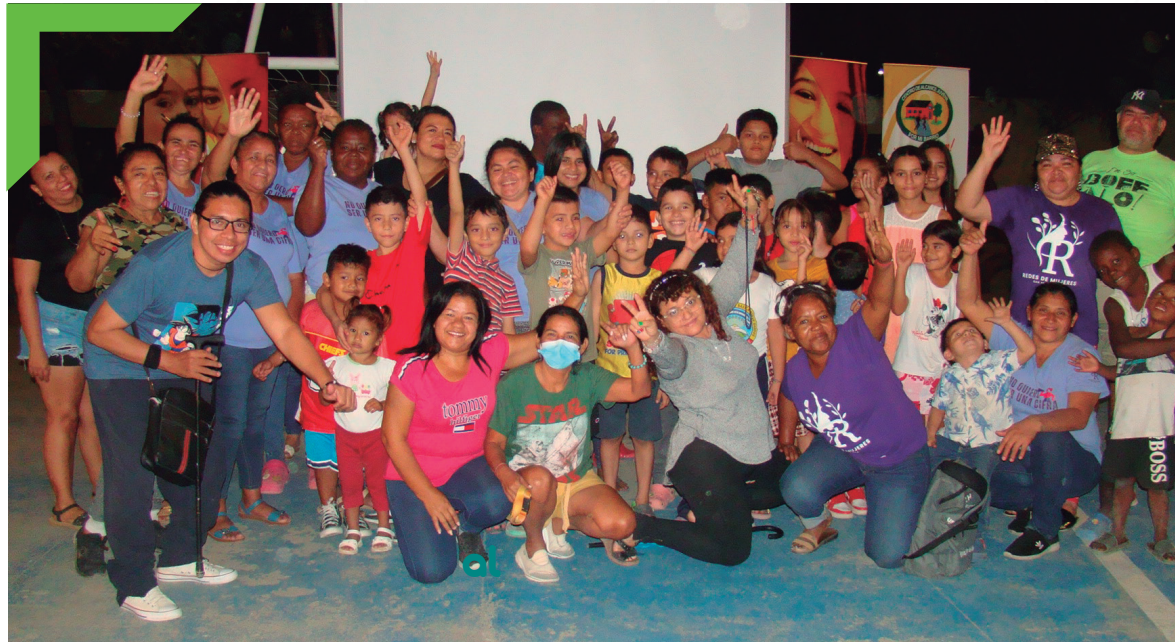
Cine comunitario de la Red de Mujeres, Riviera Hernández.