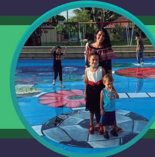
ALEGRÍA PROGRESO, YORO