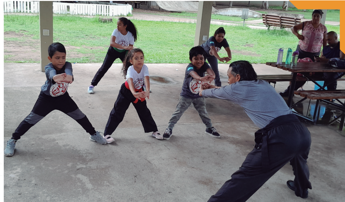
Clases de Kung-fu, San José de La Vega.