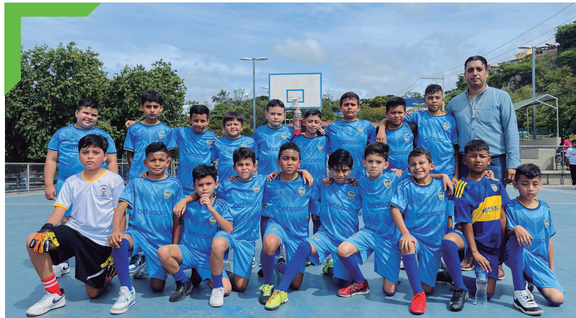
Torneo de fútbol de la Escuela William Penn, San Francisco.