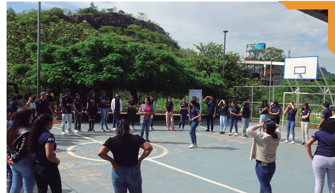
Taller sobre empleabilidad del proyecto de USAID "Creando Mi Futuro Aquí" en el Parque El Trapiche.