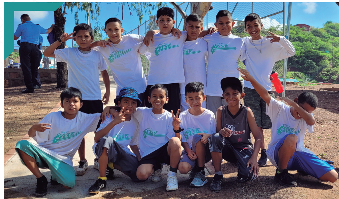
Campamento GREAT, Nueva Suyapa.