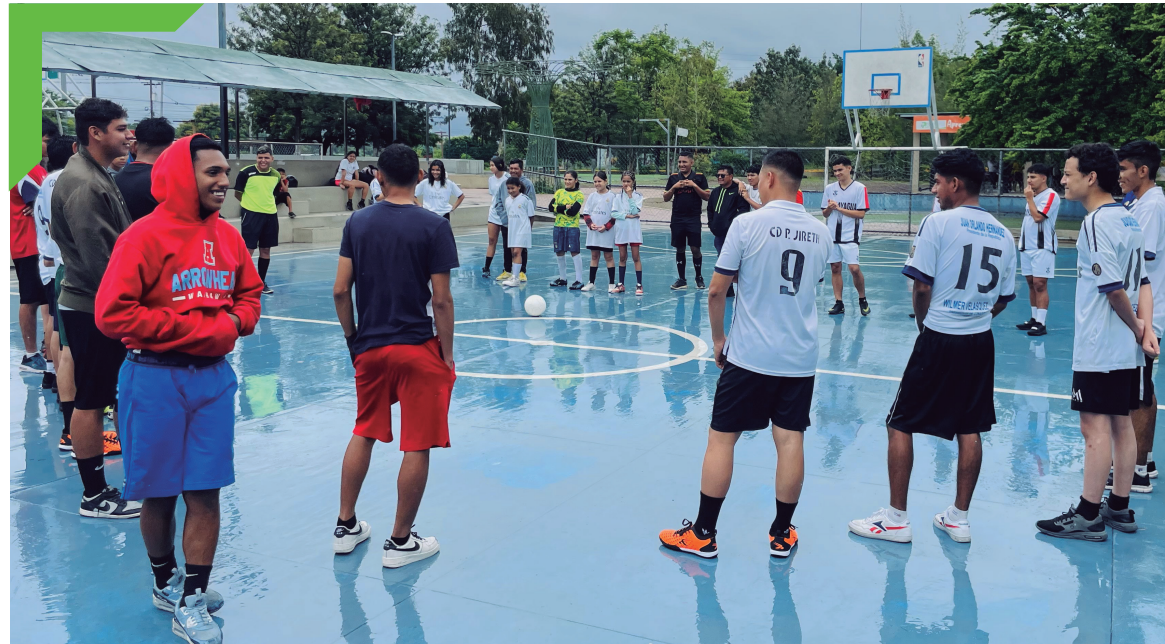
Visita recreativa de la Iglesia evangélica M.I., San Francisco.