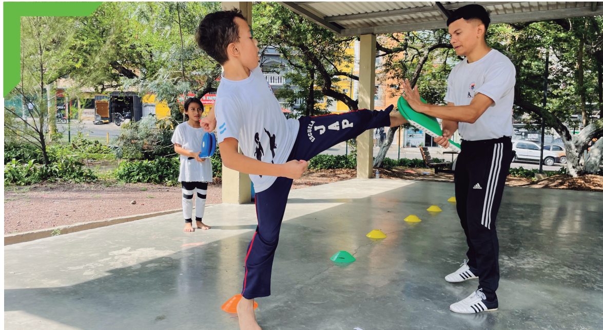
Clases de taekwondo, San Francisco.