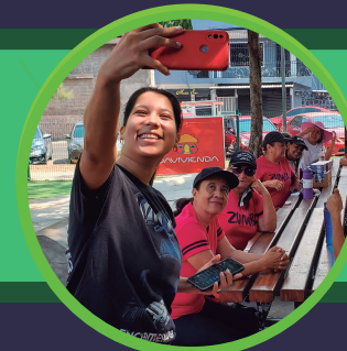
EL ESFUERZO ALTOS DE LA LAGUNA