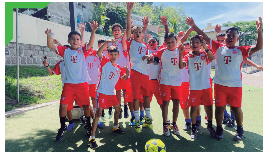
Torneo de fútbol de la Escuela La Flor #2, Campo Cielo.