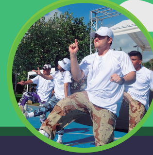
SOLIDARIDAD EL TRAPICHE