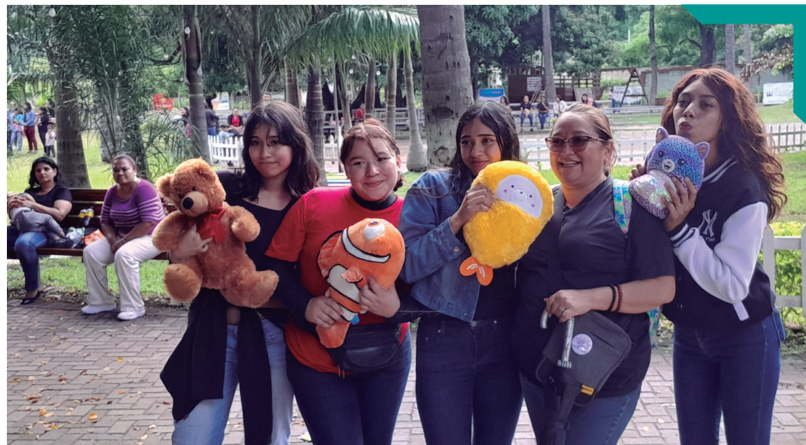
Celebración del "Día del Estudiante" por parte de la Alcaldía Municipal, en el Parque San José de La Vega.