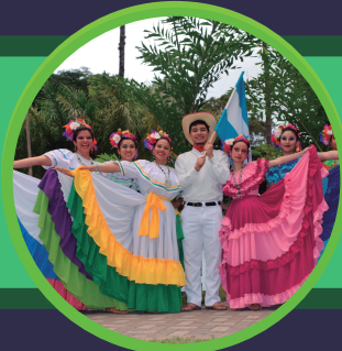
ARMONÍA EL PICACHO