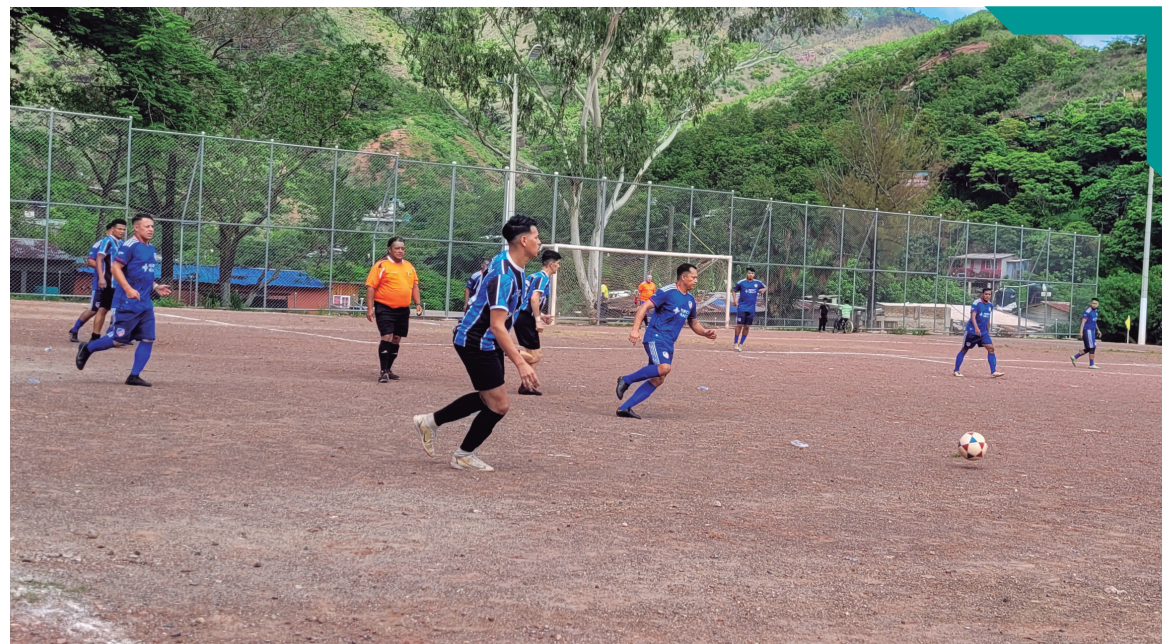
Liga de fútbol, Nueva Suypa.