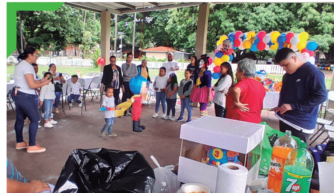
Celebraciones de cumpleaños, San José de La Vega.