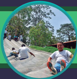
LA AMISTAD SAN FRANCISCO