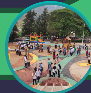
SUPERACIÓN NUEVA SUYAPA