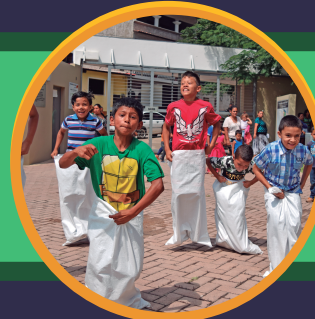
MI ESPERANZA CAMPO CIELO