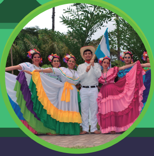
SAN JOSÉ DE LA VEGA