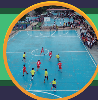
LA HERMANDAD EL HOGAR