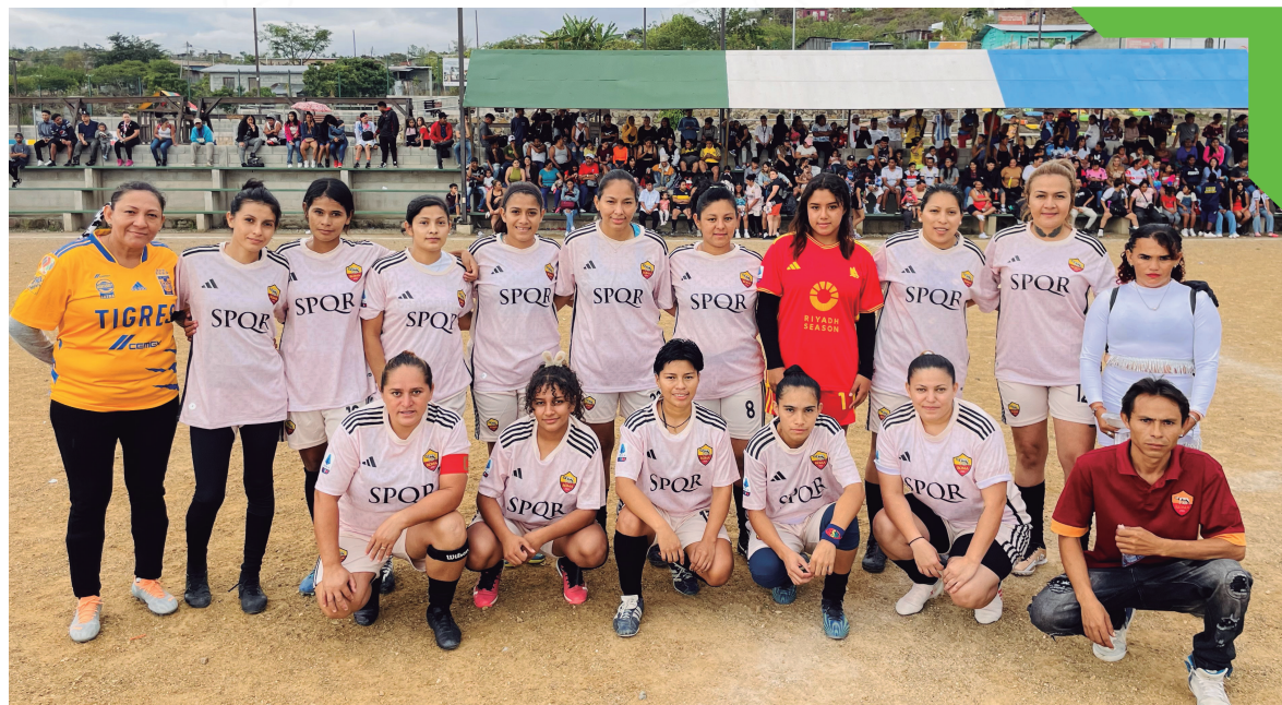
Final de la liga femenina de fútbol, Altos de La Laguna.