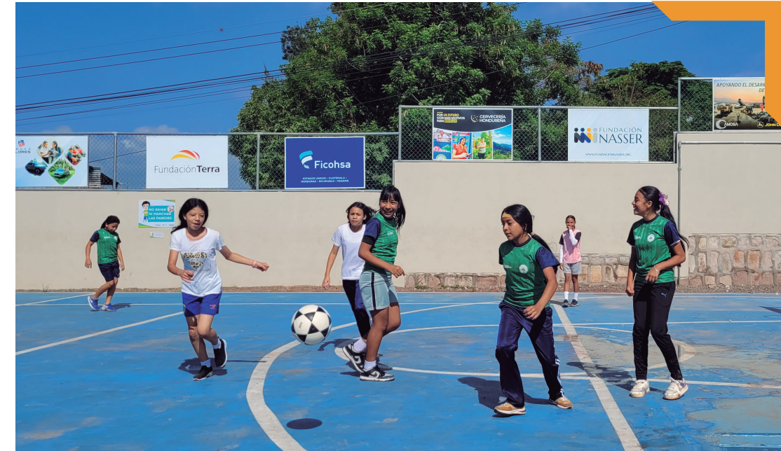
Visita de la Escuela Mary Leonard, Nueva Suypa.